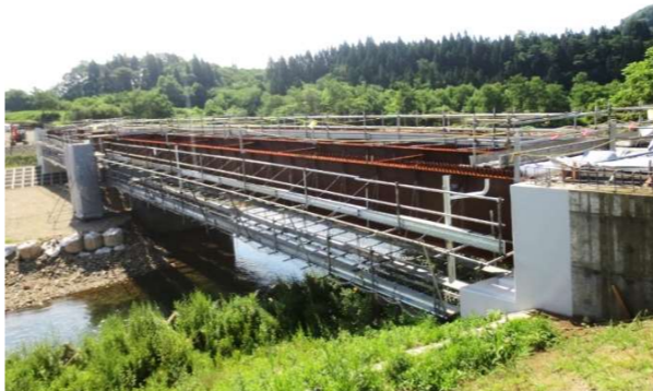
二中長面袋線橋 新橋架設工事

経年劣化、老朽化に伴う橋梁補修工事や橋梁架設工事、水門補修など、鋼構造物の製作から土木工事の現場施工まで一貫した施工体制をとっております。土木および鋼構造物ともA級格付資格を有しております。