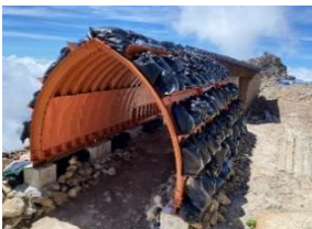
TOKO防災シェルター ドーム事業部