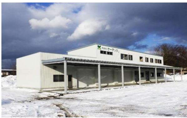
街ケータック 事務所新築工事

一級建築士1名、二級建築士2名、一級建築施工管理技士3名が所属しており、建築物の新築工事、改修工事、解体工事の設計から監理業務まで一貫した施工体制をとっております。