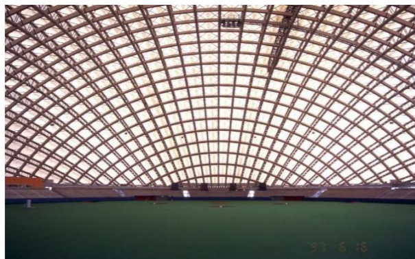
大館樹海ドーム新築工事(鉄骨工事)

Hグレード工場としてAW認定溶接技術者を多数有し、アーチ状構造物・トラス構造物など、デザイン性の高い特殊鉄骨と精度の高い一般建築鉄骨、耐震補強鉄骨を得意としております。