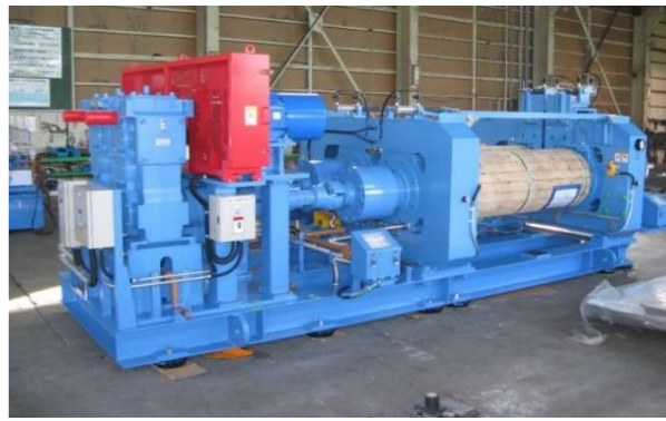
ミキシングミル設計・製作

長年蓄積したノウハウを活かし、制御設計・操作用PCソフトウェアの開発および試運転調整に至るまで、ワンストップでお客様の生産性を向上させる高性能な産業機械製作を行っております。