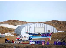
TOKOドーム ドーム事業部