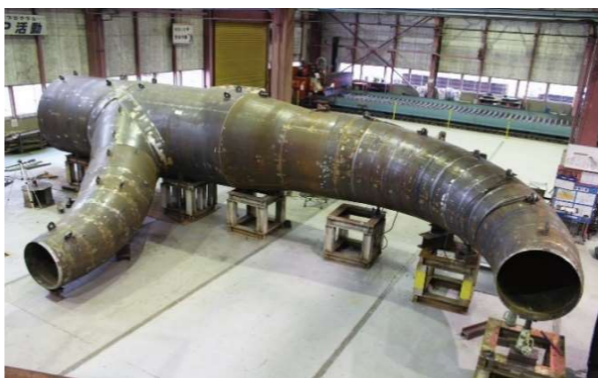
ダム向け水圧鉄管

高度な溶接技術、管理技術で設計から製作、据付まで一貫した生産体制をとっています。ステンレス専門の加工工場を有し、高品質製品の納入で高い評価をいただいております。また、40tまでの大型容器等の加工能力を有しております。