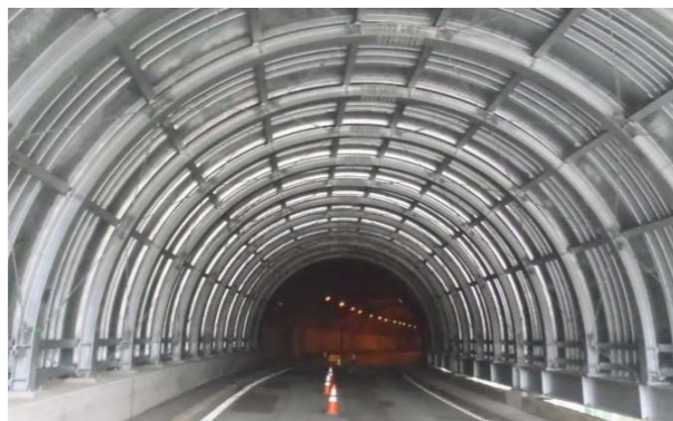
山紫スノーシェルター

大小5台の型鋼曲バンダーを使い、曲げ加工技術を活かした製品を得意としております。H形鋼の冷間曲げ加工技術に特化しており、スノーシェルターやトンネル支保工、トンネル緩衝工等の設計製作を行っております。