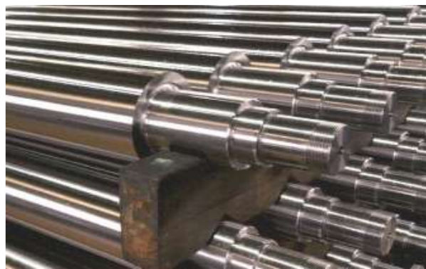
高精度ロール製品

円筒研磨加工を得意とし、各種ロール・クラックシャフト・ロッド・シリンダ製品等での高製品、高精度な部品加工を行っています。大型機械加工による部品加工から塗装・組立まで一貫した生産体制で、精度5μmの高品質製品を製造しております。