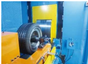
タイヤ耐久試験機 産業機械事業部