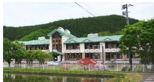
(東光雪沢テクノパーク)