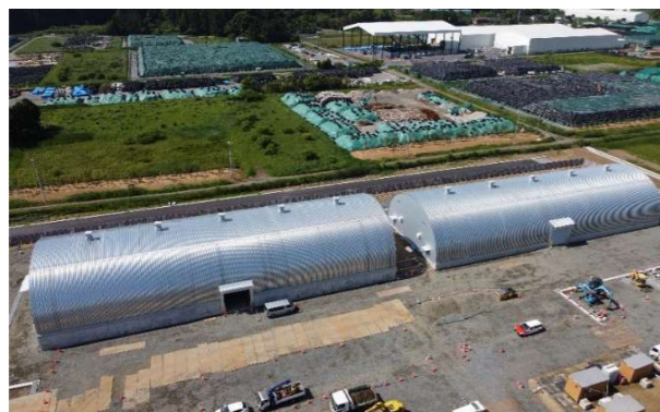
双葉13街区新築工事倉庫棟

大型デッキプレートをアーチ型に曲げる独自技術を活かした製品を製作しています。強さ・軽さ・広空間・短納期の特長を活かした自社製品TOKOドームは倉庫・格納庫として南極昭和基地でも採用されております。