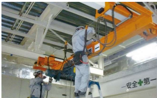
クレーン法令点検

保守点検から補修整備、据付設備と一貫したメンテナンスサポートで、保守契約に基づいたクレーン、立体駐車場、ごみ処理場における点検・整備業務や、各種機械設備のメンテナンス業務を行っております。