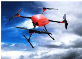
東光レスキュー ドローン® UAV事業部